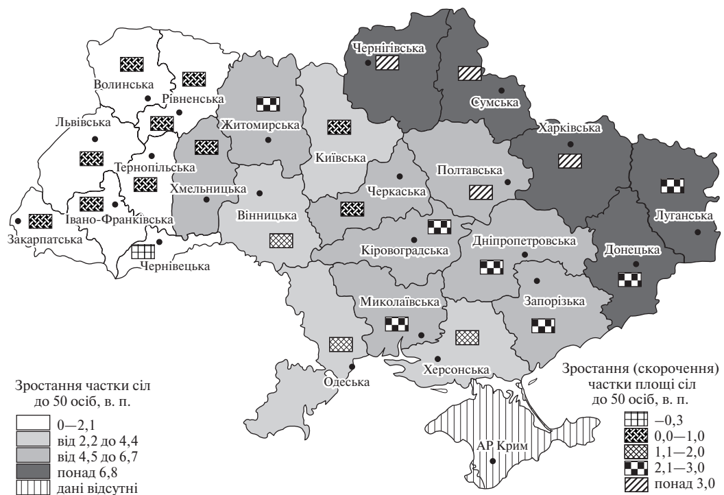
Рис. 2. Здрібнення сільських поселень в областях України, 2001–2014 рр.

Враховуючи сформовану динаміку соціально-демографічного розвитку, значне ускладнення інвестиційних умов, необхідних для відтворення економічного потенціалу сільських поселень, констатуємо, що переважна більшість із них перебуває на межі деградації. Можна очікувати, що процес інтенсивного здрібнення сільських