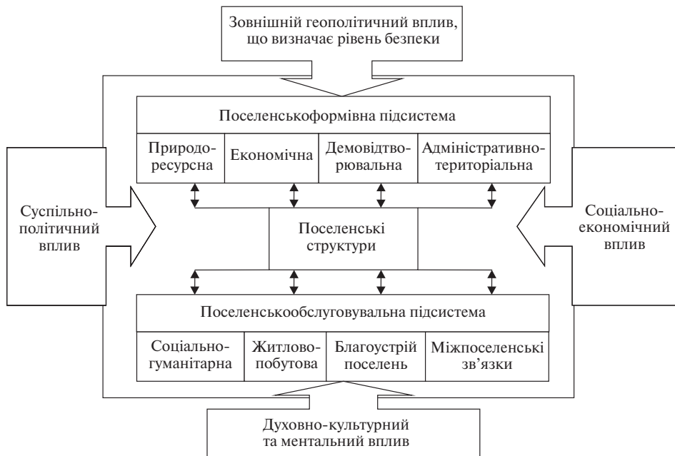
Рис. 1. Сільське розселення як трансформаційна система

У зазначеній трансформаційній системі саме територіальна локалізація структурних і функціональних зрушень визначає пріоритети управлінських рішень щодо необхідності адміністративно-територіальних змін, стимулювання процесів формування нового бізнес-середовища, а у підсумку – перспектив розвитку сільських територій, де в Україні мешкає понад третина населення. В оцінці сучасних трансформаційних змін поселенської мережі потрібно враховувати, що територія України заселена доволі нерівномірно, щільність населення змінюється у значному діапазоні на тлі депопуляційних тенденцій і процесів старіння населення. Винятком з цієї тенденції є п'ять областей (Закарпатська, Івано-Франківська, Рівненська, Тернопільська, Чернівецька), в яких чисельно переважає сільське населення і відповідні форми організації їх життєдіяльності. В Україні протягом 1990–2014 рр. сільське населення зменшилось на 2 млн 879 тис. (17 %). За цей період у Чернігівській області таке скорочення перевищило 40 %, у Сумській – 32 %; у західних областях країни воно було в межах 3,9–12,3 %.