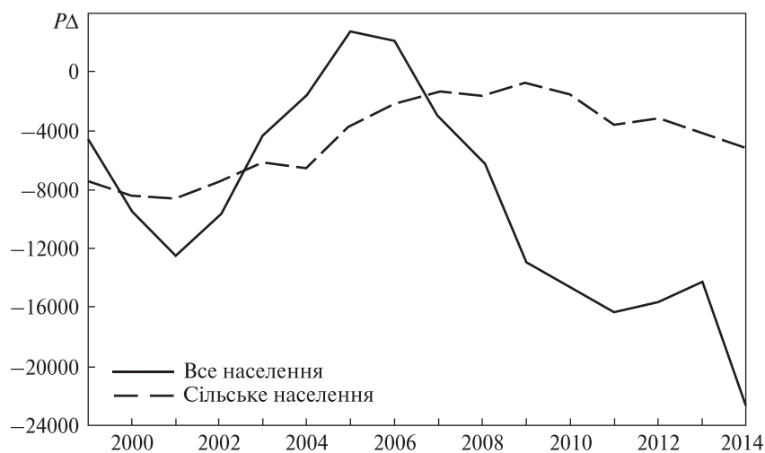
Рис. 1. Динаміка «моментного» потенціалу втрат всього і сільського населення України у 1999–2014 рр.

Розрахунок «моментної» прогностичної оцінки потенційних демографічних втрат для всього населення України у період 1999–2014 рр. здійснено за формулою (1) із використанням показника C_{\min 2004} для відображення рівня його автономного споживання. Така оцінка демонструє нелінійну динаміку значень: до 2001 р. – зростання потенціалу втрат до –12 млн осіб, потім – його зменшення аж до появи потенціалу зростання населення у 2005–2006 рр., по тому – нове зростання потенціалу демографічних втрат із стабілізацією на рівні –14: –16 млн осіб у 2012–2013 рр., нарешті його різке збільшення до майже –23 млн осіб у 2014 р. (рис. 1).