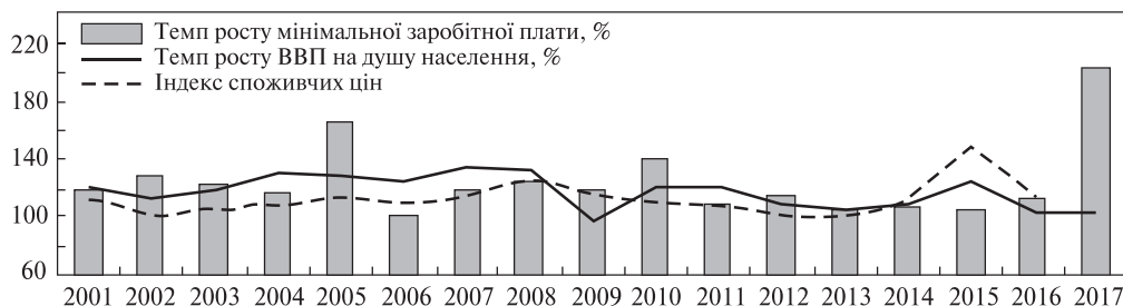
Рис. 2. Співвідношення темпів росту мінімальної заробітної плати, ВВП на душу населення і індексу споживчих цін у 2001–2017 рр.

Проте в Україні не завжди виконується вимога щодо врахування економічних чинників. Так, під час розрахунків мінімальної заробітної плати практично не враховують поточний та прогнозний рівні зростання макропоказників української економіки. Зокрема, темп приросту мінімальної заробітної плати в деякі роки (2002, 2005, 2010) значно перевищував темп приросту ВВП на душу населення. Найбільший розрив за прогнозними показниками буде у 2017 р. (рис. 2).