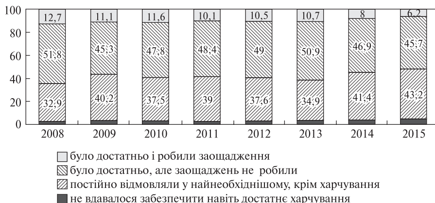
Рис. 2. Розподіл домогосподарств за самооцінкою матеріального стану протягом року, %