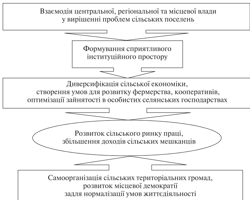
Рис. 2. Концептуальні засади формування соціально-економічного механізму, спроможного істотно вплинути на розвиток сільських поселень