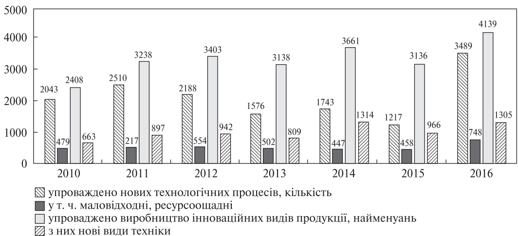
Рис. 1. Упровадження інновацій на промислових підприємствах

За цей же період найвища частка інноваційних підприємств була на підприємствах інформації та телекомунікації (22,1 %), переробної промисловості (21,9 %), фінансової та страхової діяльності (21,7 %), у сфері архітектури та інжинірингу (20,1 %). Лідерами за рівнем інноваційної активності були підприємства Рівненської, Харківської областей та м. Київ.