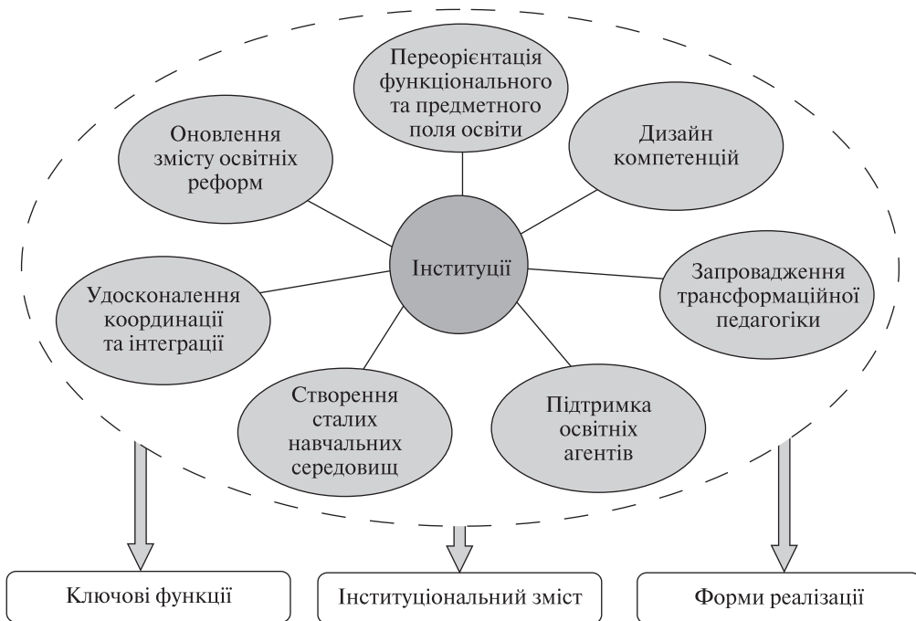
Рис. 1. Інституції у сфері освіти для сталого розвитку

розвинених країнах – ідеї раціонального природокористування 10 [6, 8]. Навіть якщо навчальний контент осучаснюється 11 , значний брак міждисциплінарних знань може відчувати переважна більшість вчителів 12 . Дослідники [6] також звертають увагу, що на зміст освіти, окрім затверджених навчальних програм, можуть впливати інші політичні документи (наприклад щодо забезпечення національного ринку праці фахівцями), а метою освітньої політики локального рівня може виявитися зниження витрат на освіту. Існує ризик порушення принципу автономності вищої освіти, навіть якщо політичні документи та стратегії різного рівня (від глобальних до місцевих) потребують переорієнтації або доповнення низки університетських курсів. Інший аспект проблеми імплементації сталості – дотримання принципу міждисциплінарності, який ускладнюється ще на етапі розробки навчального контексту (адже міждисциплінарні дослідження є складними формами досліджень, що рідко присутні у академічній практиці вищої освіти). Отже, відповідальність за широке впровадження програм сталого розвитку на національному рівні можуть взяти на себе лише ті навчальні заклади вищої освіти, які мають економічний інтерес щодо їх розробки (з огляду на їхню високу вартість). Також є занадто коштовною зовнішня незалежна оцінка щодо інтегрованості сталості у навчальний контент різних рівнів освіти.