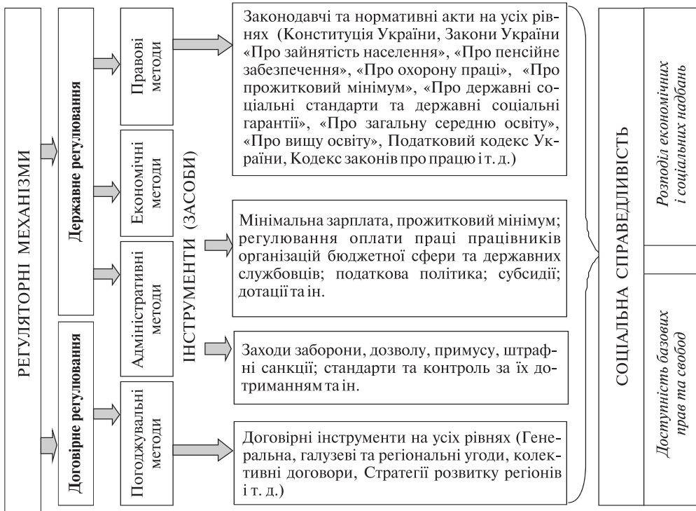
Рис. 3. Регуляторні механізми забезпечення соціальної справедливості