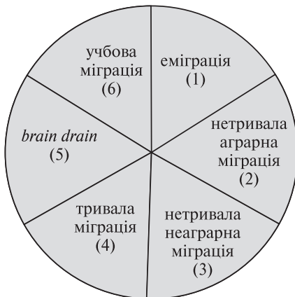
Рис. 3. Складові сучасної зовнішньої міграції українців

Перша складова – виїзд на постійне місце проживання до іншої країни; такі прагнення, часто приховані, мають і ті, хто їде за кордон з декларованою метою роботи або навчання. Цей вид міграцій, очевидно, є безповоротним і означає прямі втрати України: скорочується загальна чисельність населення і сукупна пропозиція робочої сили, втрачаються ресурси, витрачені на професійно-освітню підготовку мігрантів. Перспективи пов'язані виключно із підтримкою контактів із емігрантами, із допомогою їм у збереженні зв'язків з Україною та сподіваннями на те, що вони або (бодай частково) повернуться, або формуватимуть позитивний імідж України за кордоном. Переважно мігранти, які виїжджають з такими намірами, або відразу прямують до нової країни цілими сім'ями, або забирають туди своїх близьких за програмою воз'єднання сімей. Отже, родинні стосунки від цього практично не страждають.