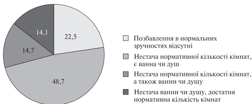
Рис. 2. Позбавлення домогосподарств нормальними житловими умовами