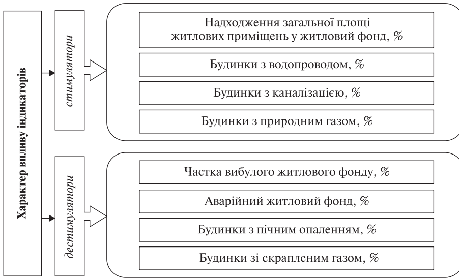
Рис. 1. Індикатори облаштування житлового фонду у сільській місцевості