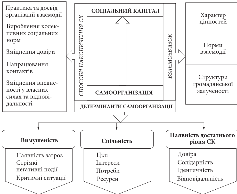
Рис. 1. Вплив самоорганізації на накопичення соціального капіталу

[10, с. 121]. До потенціалу самоорганізації нерідко відносять довіру як складову соціального капіталу, а також солідарність, ідентичність та ініціативність [11]. Існує також точка зору, що різні форми самоорганізації є джерелами соціального капіталу [12, с. 71].