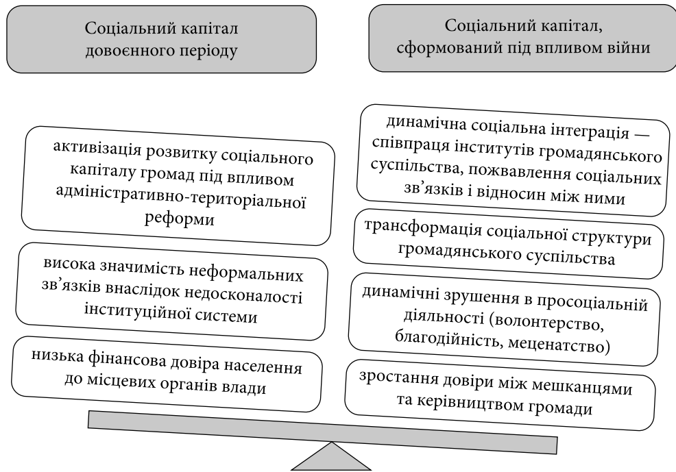
Рис. 1. Трансформація соціального капіталу територіальних громад України під впливом російсько-української війни

засобів життєзабезпечення (продукти харчування, засоби обігріву, медикаменти тощо), запобіганні випадків мародерства.