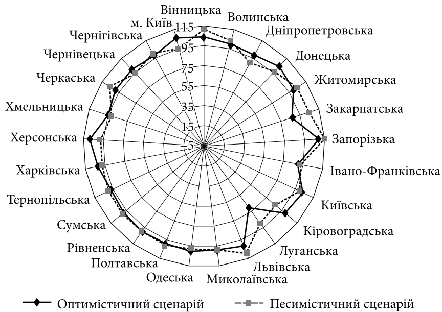
Рис. 4. Очікувані ланцюгові темпи росту (скорочення) чисельності населення в регіонах України за оптимістичним та песимістичним прогнозом, 2023 р., %

серед населення етнічно неоднорідних регіонів країни, які суттєво постраждали від військових дій. Ці мешканці характеризувались недовірою до всіх оточуючих (окрім членів сім'ї), однак спостерігався дещо вищий рівень довіри серед осіб з вищими доходами та активних учасників громадських об'єднань [9].