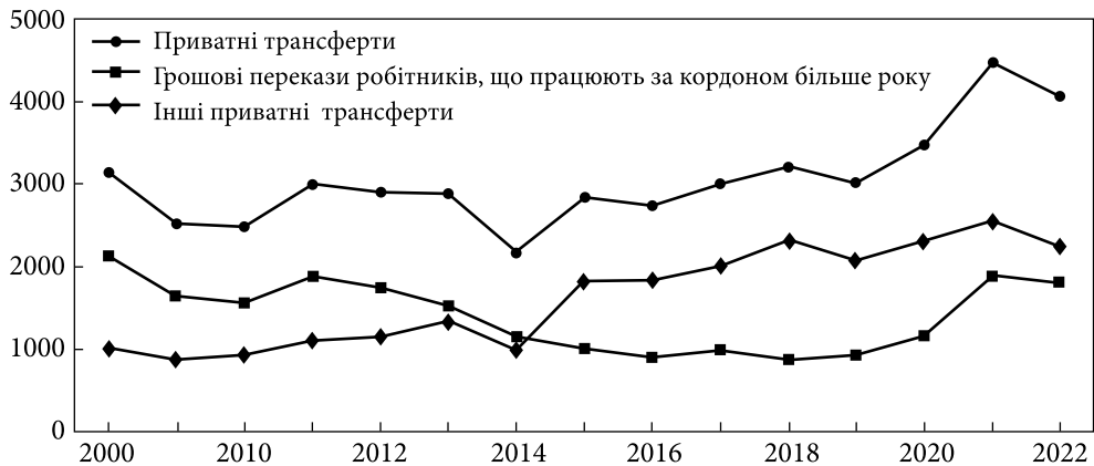
Рис. 1. Приватні трансферти в Україну впродовж 2008—2022 рр., млн дол. США

Статистика банківського сектору — не єдине джерело емпіричних даних про міждержавні грошові перекази. Інформацію збирають також у ході проведення вибіркового обстеження міжнародної міграції населення. У такому разі під грошовими переказами переважно розуміють кошти, що надсилають мігранти до родичів, друзів та інших осіб на батьківщину. Рідше розглядається ситуація, коли мігранти виступають у якості отримувачів переказів. Таке тлумачення грошових переказів наближене до поняття «приватні трансферти» у методології платіжного балансу. У цій статті для аналізу даних банківського сектору використовується термінологія КПБб, а під час роботи з даними вибіркового соціологічного обстеження і у загальних роздумах — узагальнююче поняття «грошові перекази».