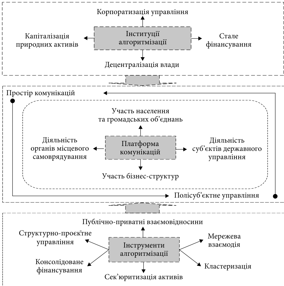
Рис. 2. Інноваційні складові алгоритму інституціональних змін в управлінні резильєнтністю в природно-ресурсній (екологічній) сфері