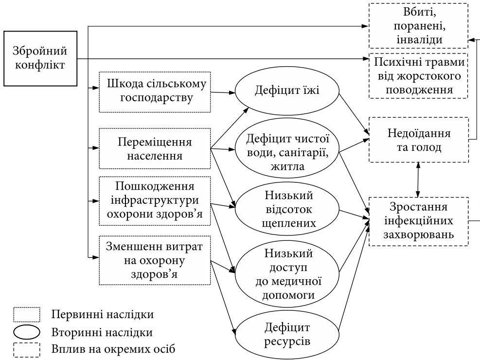
Рис. 1. Наслідки воєнного конфлікту Джерело: [21].

У 1994 р. у Сараєво створено Центр досліджень і документування ( Research and Documentation Center Sarajevo, RDC ), який у 2019 р. разом із двома іншими організаціями об'єднався для створення онлайн-ресурсу «Атлас боснійських військових злочинів» ( Bosnian War Crimes Atlas ) [18, 19]. У січні 2013 р. RDC опублікував своє остаточне дослідження про жертви війни в Боснії та Герцеговині під назвою «Боснійська книга мертвих» [20]. Ця база даних містить 97 207 підтверджених імен громадян Боснії і Герцеговини, які загинули під час війни 1992—1995 рр., і ще 5 100 непідтверджених імен. Це число удвічі перевищує дані UCDP та приблизно у чотири OWD (див. табл. 3).