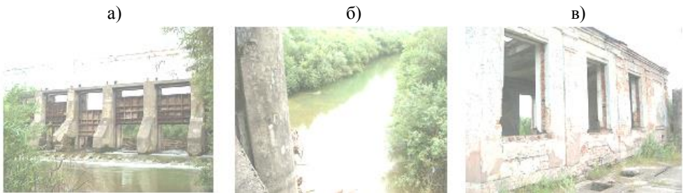
Рис. 2 – Стан гідроспоруд Новошицької МГЕС (р. Бистриця Тисменицька, Львівська обл.) до відновлення: а) вид на греблю з нижнього б'єфа; б) стан русла ріки у верхньому б'єфі; в) стан будівлі МГЕС

а) Чижівська (р. Случ, Житомирська обл.); б) Більче-Золотецька (р. Серет, Тернопільська обл.); в) Велико-Сорочинська (р. Псел, Полтавська обл.)