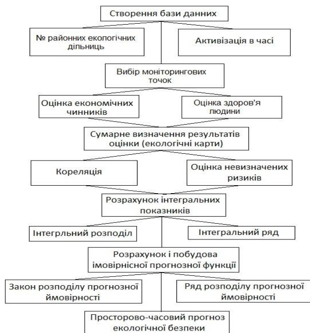
Рис. 1 – Приклад алгоритму дослідження структури автоматизованої інформаційної системи з оцінки впливу техноприродного середовища на стан здоров'я населення

Деякі показники мають бути отримані в результаті спеціальних досліджень, що фінансуються з бюджетів різних рівнів.