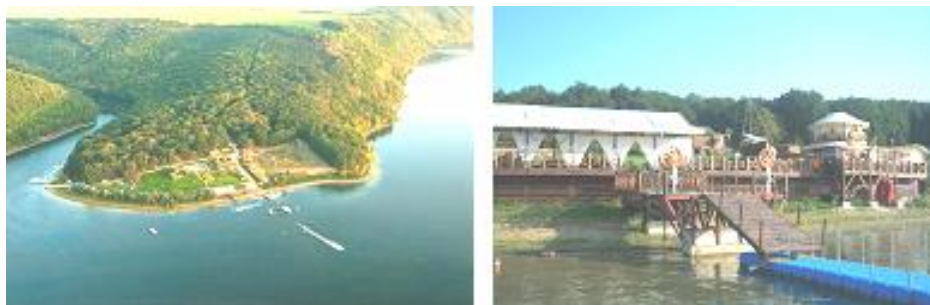
Рис. 3 – Готель «Услад» на березі Дністровського водосховища

На подібні висновки наводить наступне. Загальна протиповінева ємність водосховищ каскаду в каньйоні (147 млн м 3 ) складатиме майже чверть від протиповіневої ємності Дністровського водосховища (600 млн м 3 ) і дозволить зменшити кількість обов'язкових форсувань рівня води у Дністровському водосховищі вище нормального підпірного рівня, НПР = 121,00 м, при паводках, припливні витрати яких перевищують 2600 м 3 /с.