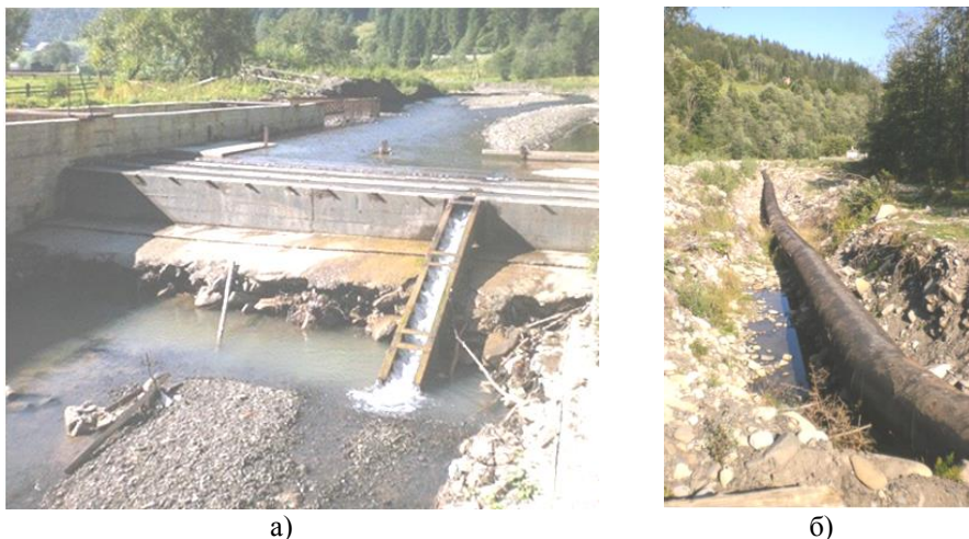
Рис. 1 – Приклади гідроспоруд на нових малих ГЕС: а) водозабірна споруда з «рибоходом»; б) «дериваційний тракт»

Насторожує в цій ситуації й те, що прикладів негативних висновків державної екологічної експертизи проектів будівництва чи відновлення малих ГЕС, про які б повідомляли в пресі чи в наукових публікаціях, не було. Навпаки, є приклади відверто не фахової державної експертизи техніко-економічного обґрунтування проектів малих ГЕС [12]. В результаті серйозно страждали інтереси місцевих сільських громад, життєдіяльність яких пов'язується з малими ріками та їх заплавками, та екологія малих річок [13].