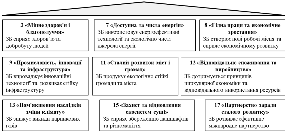
Рис. 1 – Досягнення цілей ООН зі сталого розвитку із застосуванням принципів зеленого будівництва

технологічна модернізація в узгодженні зі стандартами зеленого будівництва для забезпечення екологічно чистою енергією є найважливішим завданням, яке може як стимулювати економічне зростання, так і сприяти збереженню навколишнього середовища та зниженню темпів кліматичних змін (рис. 1).