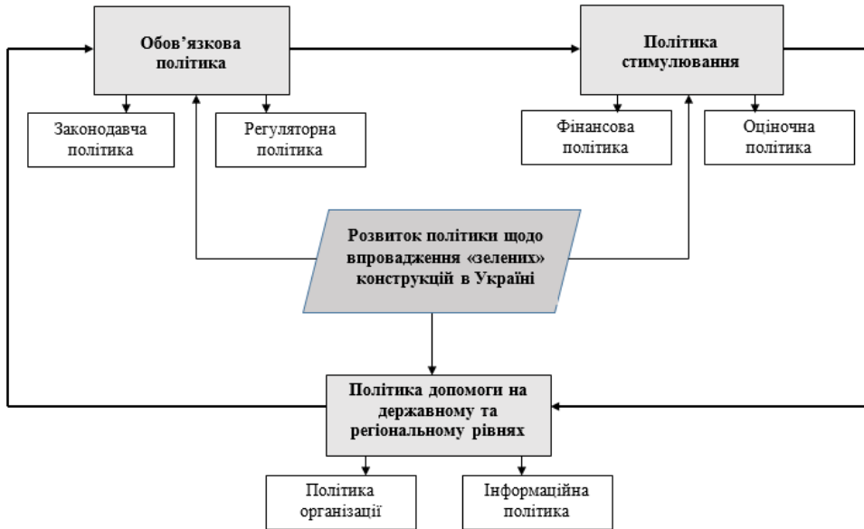
Рис. 3. Рекомендована система заходів для розвитку та впровадження «зелених» дахів в Україні

існуючі або новостворені системи, пов'язані з екологічним сталим розвитком, розробка комплексної системи оцінки ефективності «зелених» конструкцій, встановлення системи маркування).