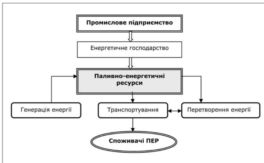
Рис. 2. Об'єкти енергозбереження на промисловому підприємстві

Діяльність із енергозбереження, як і будь-який інший вид діяльності, має об'єкти і суб'єктів. Об'єктами енергозбереження на промисловому підприємстві можуть бути (рис. 2): підприємство у цілому (виробничі та допоміжні підрозділи) або його окремі частини, енергетичне господарство, ланки генерації транспортування, перетворення і споживання енергії. Паливно-енергетичні ресурси на підприємстві можуть надходити ззовні або генеруватися безпосередньо на виробництві. Для цього використовується енергія вітру, сонця, біомаси, води та інші природні джерела. Зовнішні й генеровані власними силами ПЕР складають загальну сукупність енергетичних ресурсів, які можуть транспортуватися безпосередньо до споживача або на підприємства з перетворення енергії. До перетворювачів енергії належать електрогенератори, трансформатори, котельні, обладнані паровими і водяними котлами, повітряні компресори та інші пристрої. Від перетворювачів енергія в потрібній формі транспортується до споживача. Зауважимо, що найбільші втрати на промислових підприємствах спостерігаються на ланках транспортування, споживання і перетворення енергії.