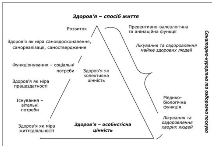
Рис. 1. Функціонально-цільове наповнення санаторно-курортної та оздоровчої послуги в ієрархії потреб

Дедалі частіше люди виявляють інтерес до здорового способу життя. Вони приїждять у санаторно-курортні за-