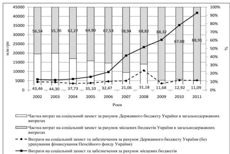
Рис. 2. Динаміка зміни абсолютного та відносного розміру витрат на соціальний захист і соціальне забезпечення за рівними бюджетної системи

З огляду на це на місцевому рівні негайного вирішення, на нашу думку, потребують такі питання: удосконалення міжбюджетних відносин у напрямі збільшення повноважень місцевих органів влади при розрахунку потреби у фінансових ресурсах для соціального захисту населення;