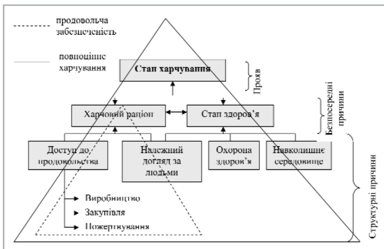
Рис. 1. Концептуальна основа харчування на рівні домогосподарства Джерело: [7, с. 7]

У цьому контексті одним із найбільш показових прикладів нераціональної поведінки українських домогосподарств