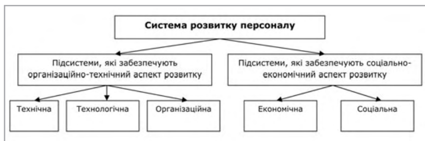
Рис. 2. Структура системи розвитку персоналу

Однак, на нашу думку, такий поділ є дуже загальним, може стосуватися будь-якої системи і не розглядає спе-