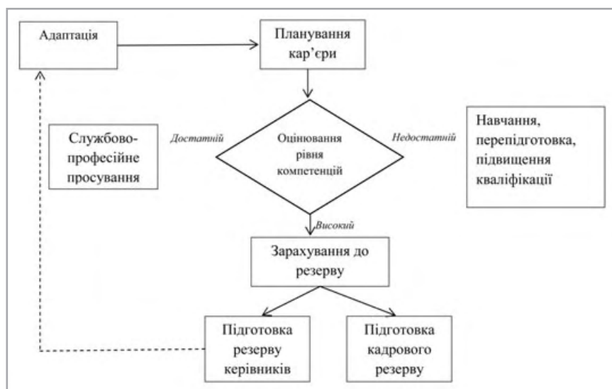
Рис. 4. Процес розвитку персоналу організації

Взаємозв'язок організаційної культури та окремого працівника починається від моменту його прийому на ро-