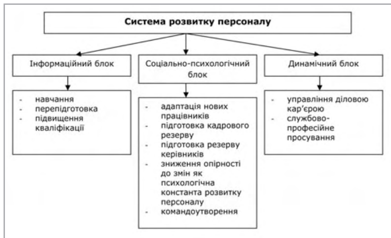
Рис. 3. Система розвитку персоналу

Відповідно до нашого підходу систему розвитку персоналу слід поділити на три блоки (рис. 3.)