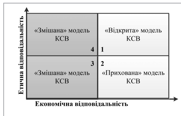
Рис. 2. Проекція юридичної відповідальності кубічної моделі корпоративної соціальної відповідальності

Проекція юридичної відповідальності матиме такий вигляд (рис. 2).