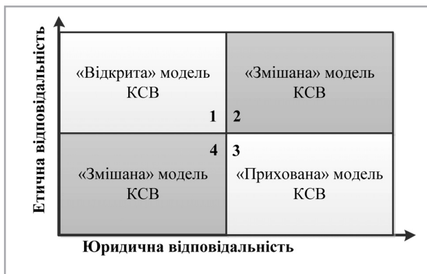
Рис. 3. Проекція економічної відповідальності кубічної моделі корпоративної соціальної відповідальності

І, нарешті, проекція економічної відповідальності кубічної моделі корпоративної соціальної відповідальності прийме наступний вид (рис. 4). У цьому випадку незалежно змінною вже є юридична відповідальність корпорації, яка посідає друге місце в піраміді А. Керола, а залежною – етична відповідальність. Економічну відповідальність приймаємо за константу, тобто, припус-