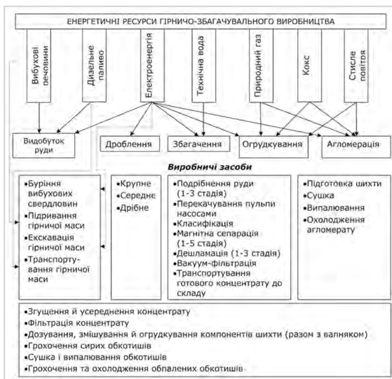
Рис. 1: Енергетичні ресурси для забезпечення технологічного процесу видобутку й переробки ЗРС

Сьогодні в загальній структурі енерговитрат на частку видобутку залізної руди припадає близько 12% (6,4–8,3 кВт*год. на тону руди). Найбільш енергоємні процеси на родовищі пов'язані з використанням внутрішньокар'єрного транспорту (у середньому 3,0–3,5 кВт*год. на тону залізної руди) і транспортування руди з кар'єру на збагачувальну фабрику (2–3 кВт*год. на тону руди). Усі заходи щодо енергозбереження на стадії видобутку залізної руди можуть бути розділені на кілька організаційно-технологічних напрямів, основними серед яких