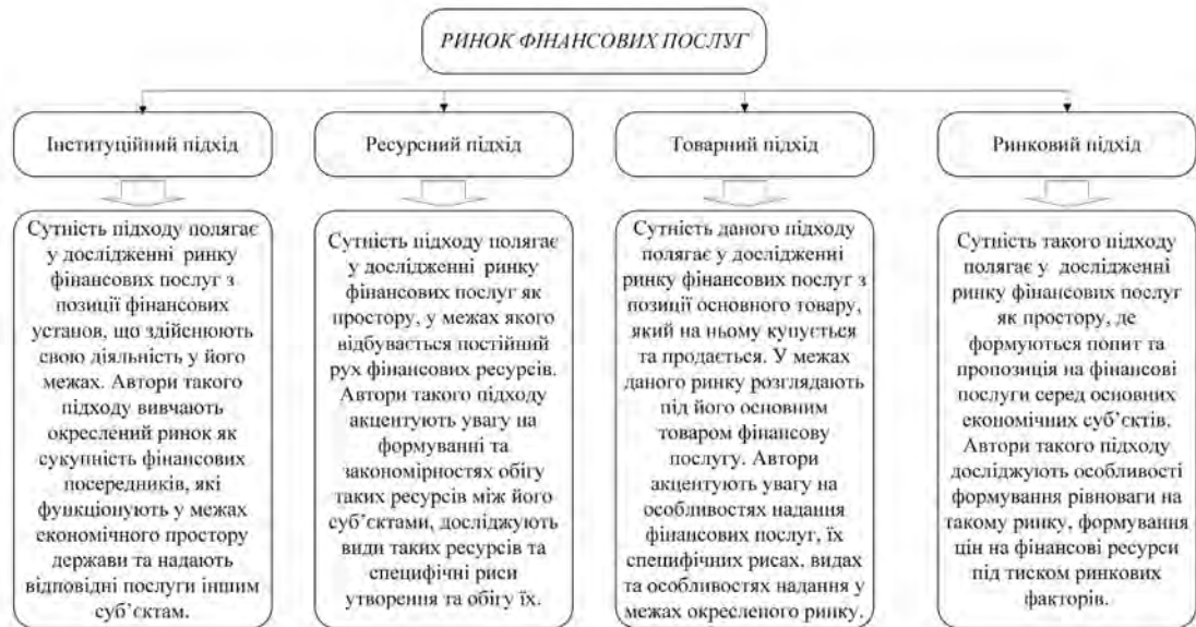
Рис. 2: Наукові підходи до дослідження сутності ринку фінансових послуг