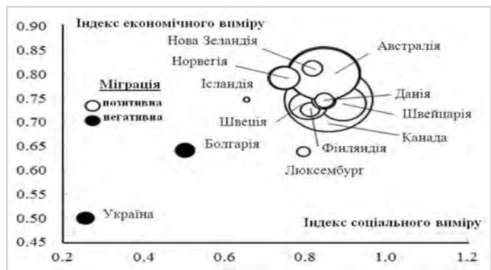
Рис. 1: Розміщення країн у координатах обсягів чистої міграції у розрізі співвідношення індексу економічного виміру до індексу соціального виміру, 2014 р.

Варто зазначити, що у той час, коли індекс соціального виміру досліджуваних країн у 2014 р. в середньому сягав 0,756, в Болгарії він складав 0,659, а в Україні становив 0,517 [19]. Середнє значення індексу економічного виміру досліджуваних країн – 0,808. В Україні індекс економічного виміру у 2014 р. складав всього 0,299, в Болгарії – 0,540 [19], що, відповідно, на 0,588 та на 0,347 менше, ніж у Швейцарії, де даний показник сягав найвищої позначки – 0,887. Окрім Швейцарії, слід відмітити й інші країни ТОП-10, які за показником індексу економічного виміру вище середнього значення (0,808), а саме: Канаду (0,842), Австралію (0,837), Нову Зеландію (0,831), Данію (0,818), Фінляндію (0,819) та Швецію (0,809) [19]. Даний