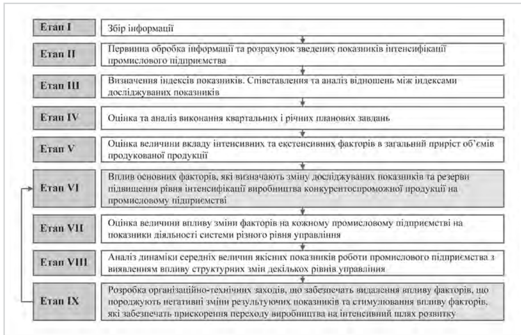
Рис. 2: Алгоритм оцінки факторів впливу на динаміку значень важливих техніко-економічних показників промислового підприємства