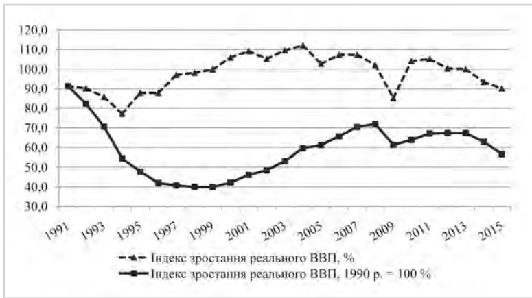
Рис. 1: Індекси зростання реального ВВП в 1992–2015 рр., %