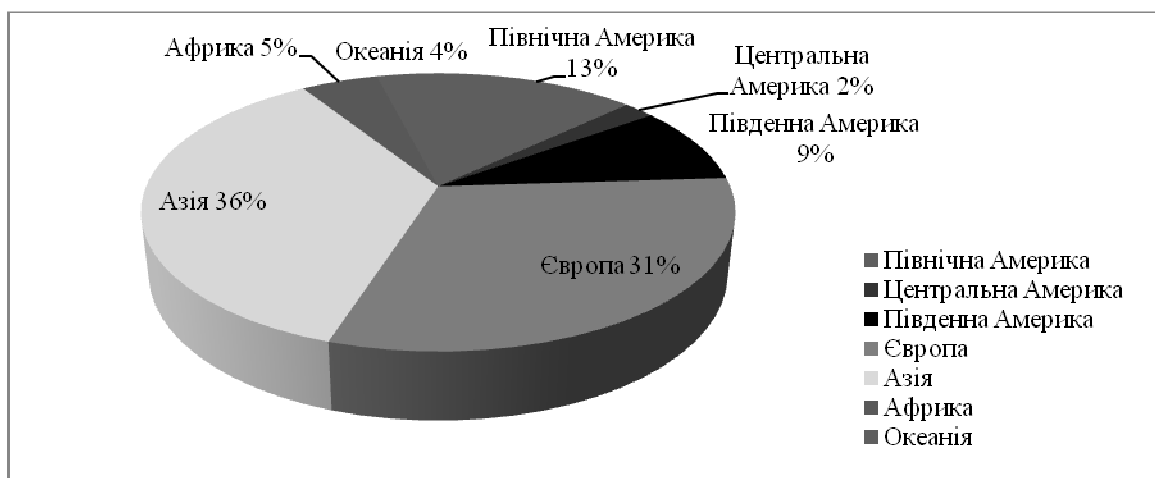
Рис. 2. Розподіл світового виробництва молока в 2010 році у розрізі географічних регіонів

Обсяг виробництва молока в світі визначається наявним поголів'ям та продуктивністю. Так, поголів'я корів у світі збільшилося від 239,7 млн. голів у 2005 р. до 277,6 млн. голів у 2009 р., або на 15,8 %. Аналіз показує, що в країнах з поголів'ям від 5 млн. корів і більше налічується 75,04 млн. голів, або 27,03 % від усього стада в світі. Країн де кількість корів перевищує 2,5 млн. голів налічується 16,7 млн. голів – 6 відсотків. В більшості країн світу спостерігається зростання обсягу виробництва молоко-сировини за рахунок підвищення продуктивності корів. Так, у США протягом 2005-2009 рр. продуктивність корів зросла від 8877 кг до 9332 кг, у Китаї - від 2500 кг до 2832 кг, Росії - від 3202 до 3698 кг, Польщі