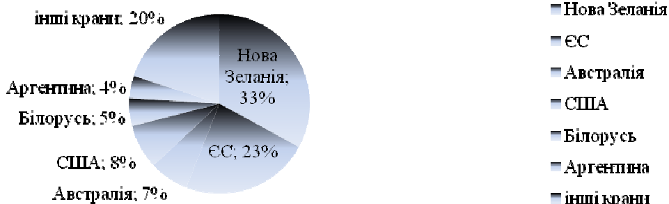
Рис. 3. Структура світового експорту у 2010 році