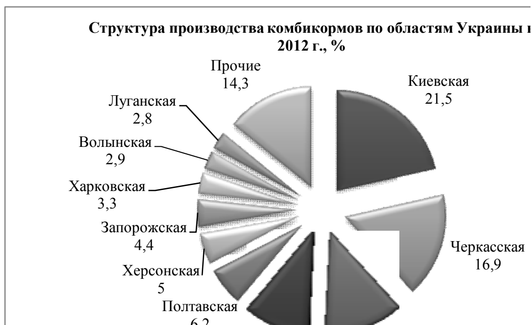
Рис. 3. Структура производства комбикормов по областям в 2012 г., % [5]

Структура производства комбикормов по областям Украины в 2012 г. представлена на рис. 3.