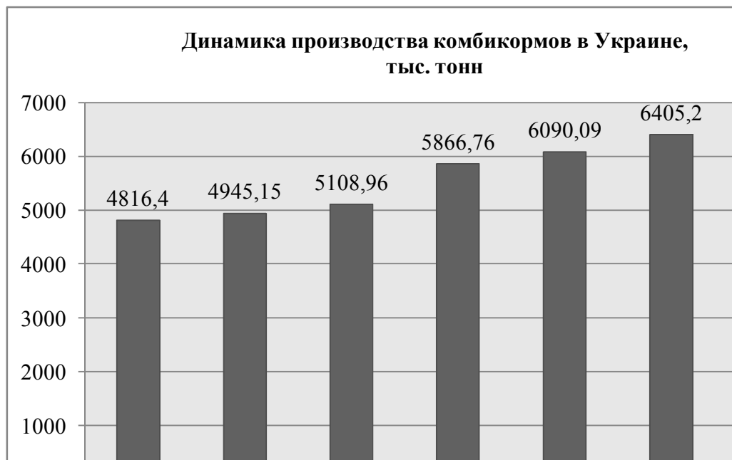
Рис. 2. Динамика производства комбикормов с 2006 по 2012 гг.

Лидерами производства комбикормов в Украине являются Киевская (22%), Черкасская (17%), Днепропетровская (12%) области.