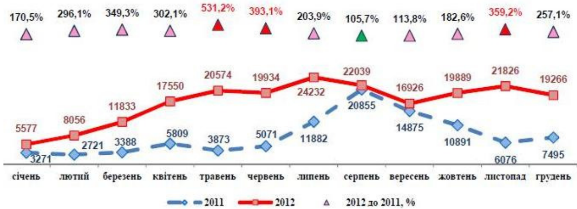
Рис. 3. Обсяги імпорту свинини, тис. т

ни досяг рекордних значень за останні роки – 4,3 тис. т, що у 2 рази перевищує рівень липня 2011 р. Збільшення відбулося за рахунок активізації ввезення свинини з Бразилії – майже 15 тис. т та Німеччини – 4,8 тис. т (у липні 2012 р.).