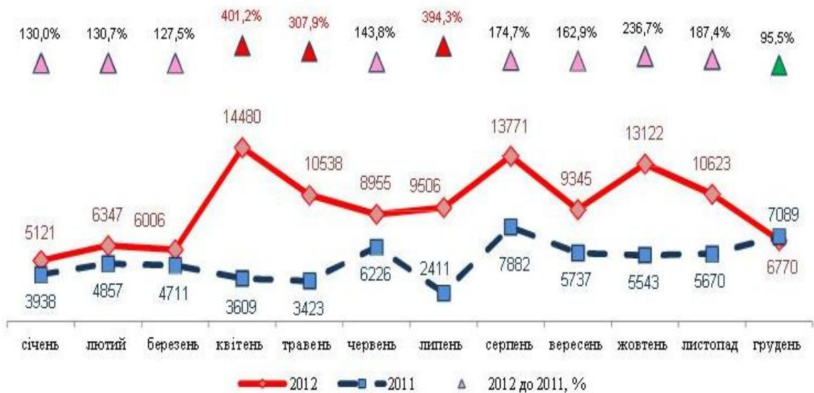
Рис. 4. Обсяги імпорту м'яса та їстівних субпродуктів птиці, тис. т

У 2012 р. імпорт м'яса та їстівних субпродуктів птиці збільшився на 87,6%, порівняно з 2011 р., і становив 114,6 тис. т. (Рис. 4).