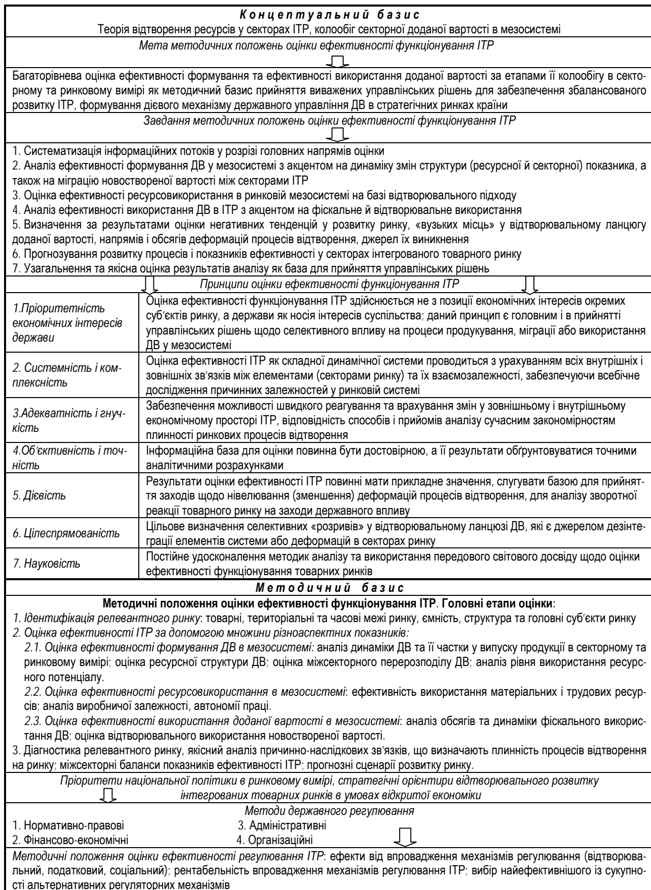
Рис. 2. Структурна схема методологічного підходу до оцінки ефективності функціонування інтегрованого товарного ринку *