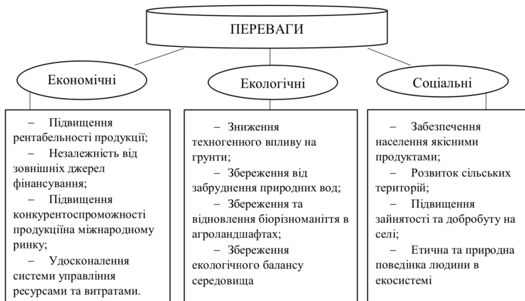
Рис. 1. Переваги органічного виробництва*

*Складений автором за даними джерела [2]