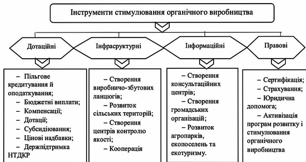
Рис. 3. Інструменти стимулювання органічного виробництва*

Аналізуючи всі тенденції, пропонуємо наступну розробку механізму стимулювання розвитку органічного виробництва на підприємствах аграрного сектору (рис. 3).