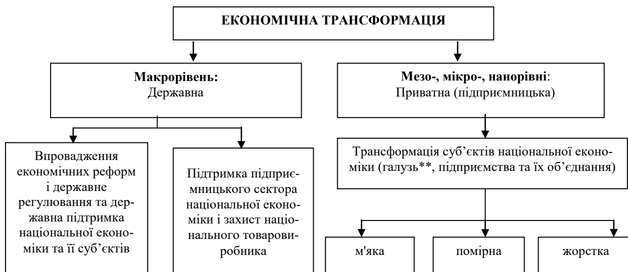
Рис. 1. Підхід до структуривання понятійно-категоріального апарату «економічна трансформація» національної економіки в залежності від рівня виникнення і цілей її проведення*