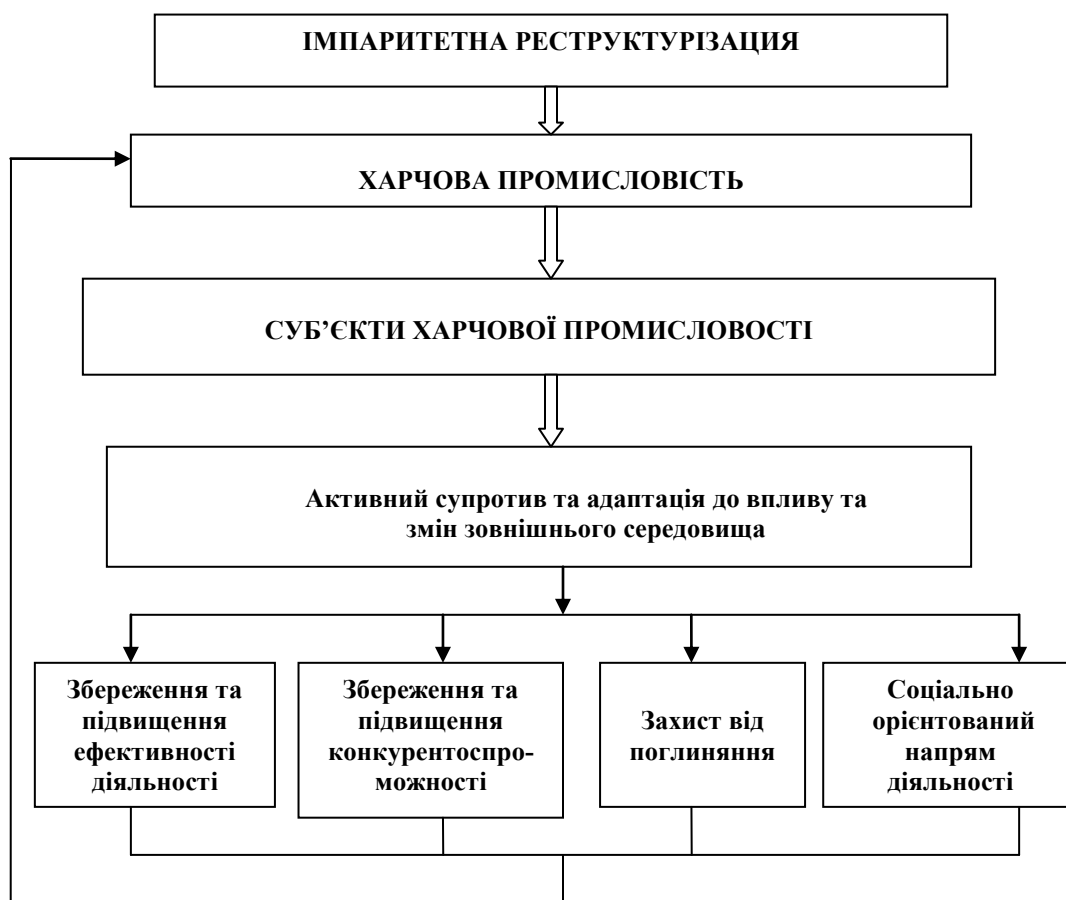
Рис. 2 – Сутність імпаритетної реструктуризації харчової промисловості в сучасних умовах* *авторська розробка [1, с. 187]

Як показали наші дослідження [1, с. 186-189], в контексті проведеного дослідження, принципи, на нашу думку, – це базові положення проведення імпаритетної реструктуризації у відповідності з цілями її проведення, стратегією розвитку суб'єктів національної економіки, наприклад, харчової промисловості, а також факторами впливу зовнішнього середовища (рис. 3).