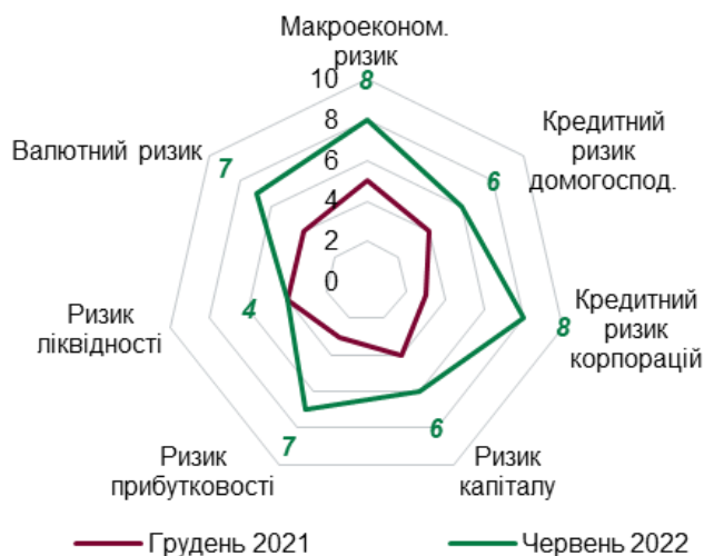
Рис. 2. Структура ризиків грошового ринку України у воєнний період*

*побудовано на основі офіційних даних Національного банку України