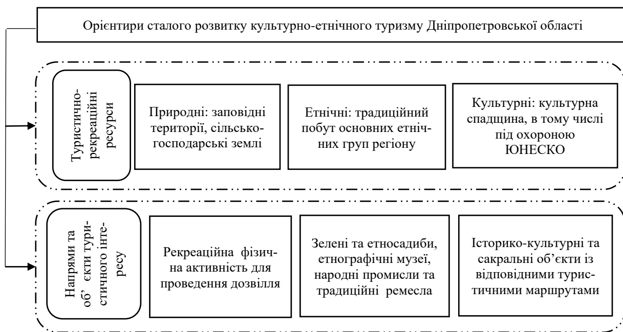
Рис. 1. Орієнтири розвитку культурно-етнічного туризму Дніпропетровської області*

На жаль, у Дніпропетровській області на сьогоднішній день не затверджено регіональну програму та моделі розвитку культурно-етнічного туризму, не розроблені дорожні карти реалізації потенціалу етнічних територій у сфері туризму. У рамках дослідження територіальної соціально-економічної системи Дніпропетровської області були виокремлені регіональні орієнтири щодо побудови регіональної політики культурно-етнічного туризму (рис. 1).