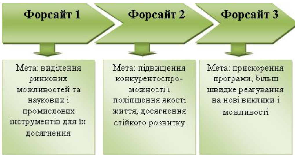
Рис. 1. Процес форсайтінгу у Великобританії

Однією з перших країн, що почала використовувати механізм форсайту у розробці державних програм була Великобританія. Форсайтінг відбувався у три етапи (рис.1).