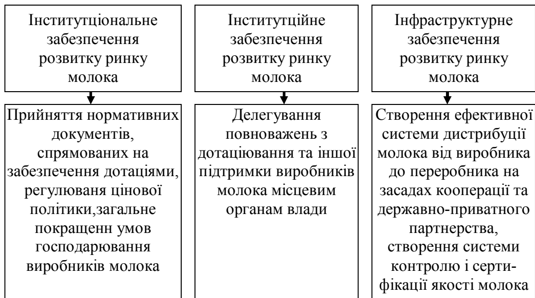
Рис. 2. Стратегічні напрямки модернізаційного забезпечення розвитку ринку молока в Україні

В цьому аспекті доцільно навести досвід Польщі для порівняння стану молочної промисловості з Україною. Польща є потужним європейським та світовим виробником сільськогосподарської продукції та продуктів харчової промисловості. Ця країна посідає шосте місце в Європі за обсягами виробництва м'яса та молока. Польща увійшла до Європейської спільноти із високими показниками виробництва у тваринницькій галузі. Підготовка до членства у Європейському Союзі сприяла концентрації вигодовування молочної та м'ясної худоби. Це стало причиною того, що з ринку пішло багато малих виробників (особливо це стосувалося вигодовування молочної худоби). Проте інтеграція в ЄС дала змогу збільшити рентабельність виробництва яловичини та молока, а також наростити експорт м'ясо-молочної продукції. Відкриття кордонів країн ЄС сприяло істотному зростанню експорту молочної продукції, переважно знежиреного сухого молока та сирів. Стимулюючу дію мають високі ціни у торгівлі з країнами ЄС. Сухе молоко з Польщі направляється головним чином в ЄС-15 та в треті країни (за межами ЄС-25), зокрема в Алжир. Сир — у ЄС-25 (у т.ч. у Чехію, Німеччину та Голландію). Тваринне масло експортується головним чином у Бельгію, Німеччину та Голландію [7, 10]. Після вступу до ЄС відмічається зростання зовнішнього попиту на молоко та сметану в якості сировини для подальшої переробки, а також йогуртів та молочних напоїв, що є досить новим явищем для