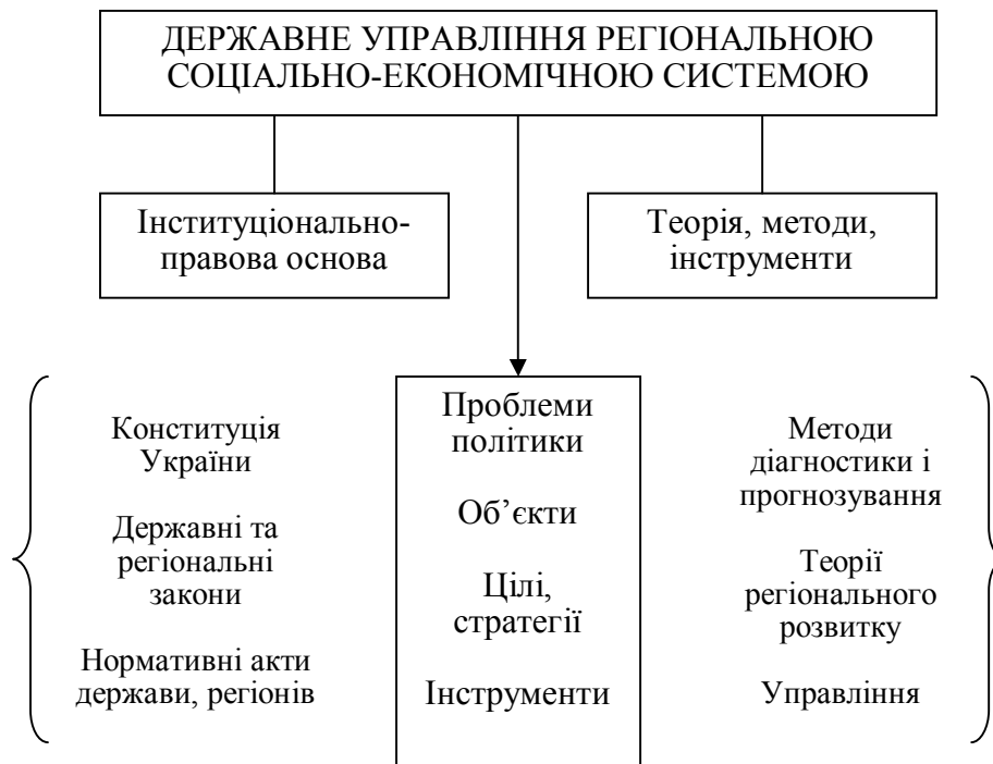
Рис. 1. Методологія державного управління регіональною соціально-економічною системою [15, с. 66]

У теоретичному плані постає важлива проблема співвідношення розмаїтості наявних проблем, цілей і пропонованих інструментів, а також оцінки ефективності використовуваного економіко-політичного інструментарію й реалізованих цільових програм. Методи проведення державного управління регіональною соціально-економічною системою також обумовлені системою ринково-маркетингового господарства регіону. Під методами прийнято розуміти сукупність прийомів і засобів впливу на господарюючі суб'єкти господарювання й методи опосередкованого впливу. Перші з них у більшому ступені стосуються об'єктів, які відносяться до власності суб'єктів України, інші – всіх інших об'єктів. На рис. 2 подані принципи державного управління регіональною соціально-економічною системою.