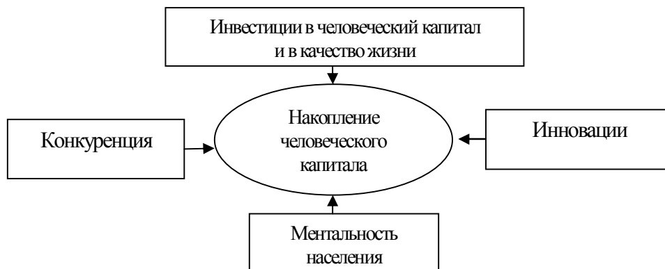
Рис. 1. Факторы, влияющие на накопление человеческого капитала

Исследования показывают, что эффективность инвестиций в ЧК определяется рядом факторов, которые могут быть сведены к следующим четырем: качество жизни, активность инновационной деятельности, наличие конкуренции и ментальность населения (рис. 1).