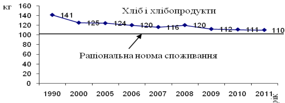
Рис. 1. Динаміка споживання продуктів першої групи

продукти, рівень споживання яких балансує на рівні раціональної норми (яйця, цукор).