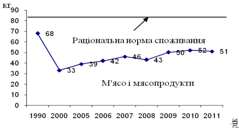
Рис. 2. Динаміка споживання продуктів другої групи

Графічна інтерпретація динаміки споживання продуктів першої та другої груп представлені на рис. 1 та рис. 2. Графіки дають змогу зробити висновок, що по аналізованих групах ні у 1990 року та опісля не було досягнуто рівня раціонального споживання. Втім, динаміка обсягів споживання по рокам, має позитивні тенденції. Кількість продуктів харчування першої групи в раціоні населення України поступово знижується до рівня раціональної норми, а другої підвищується до раціональної норми. Це свідчить про те, що продукти низькокалорійні витісняються висококалорійними продуктами і відбувається збалансованість раціону харчування (рис. 3 та рис. 4). У 2011 році по відношенню до 1990 року тільки продукти групи «Молоко і молокопродукти» мають тенденцію до зростання розриву між фактичним