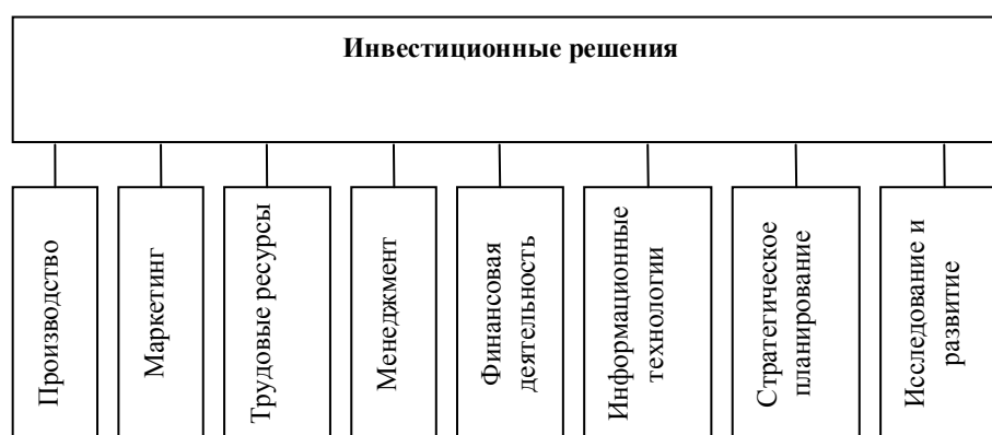
Рисунок 2 – Инвестиционные решения в сферах деятельности промышленного предприятия

Следует отметить, что большинство авторов рассматривают термин инвестиционное решение как решение о том вкладывать финансы или нет, но в крупных промышленных проектах в процессе инвестирования (уже принятого решения об инвестировании) могут возникать проблемы, требующие принятия дополнительных решений в рамках инвестиционного проекта. Такие решения тоже являются инвестиционными, и поэтому все решения о привлечении заемного капитала следует рассматривать, как инвестиционные решения, на всех этапах жизненного цикла инвестиционного проекта в разрезе всех сфер деятельности предприятия (рис. 2).