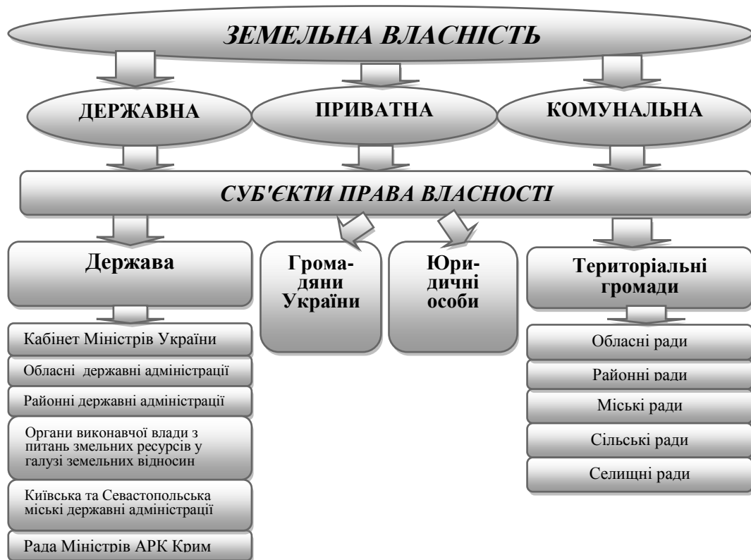
Рис.1 Перелік суб'єктів прав власності наземлю

Існують певні обмеження щодо приватизації земель. Так, відповідно до ст. 83, 84 Земельного кодексу України: