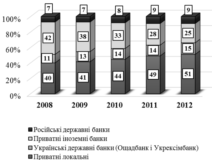
Рис. 2. Частка груп фінансових установ у чистих активах української банківської системи, 2008-2012 рр., % [3-5]

Частка західних приватних фінансових установ (не беручи до уваги російських державних) у загальних чистих активах банківської системи зменшилася з майже 42% (на початку 2009-го) до 25% (у першій половині 2012-го) й здебільшого саме на користь місцевих українських банків (рис. 2).