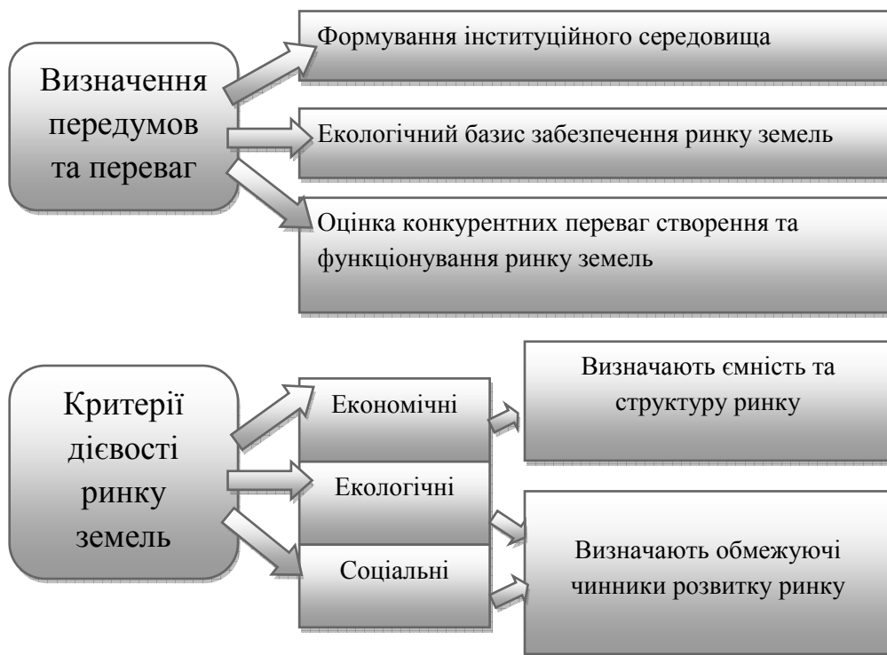
Рис. 2 Структурна модель інфраструктури ринку земель

Проте очевидно, що діюча зараз кредитна система, ні державна підтримка, ні активізація на фондовому ринку не в змозі в найближчий час забезпечити необхідний фінансовий базис розвитку галузі. Суттєве збільшення притоку капіталу може дати завершення земельної реформи та включення землі в економічний обіг. Земельна реформа повинна стати основою фінансово-кредитного забезпечення розвитку галузі. В Україні попередніми етапами реформи земельний капітал фактично незадіяний в економічному обороті, оскільки де-юре належить фізичним особам, які здебільшого не розуміються в підприємстві. Крім того, спостерігається практика виснажливого та неефективного використання земельних ресурсів за еколого-економічними принципами.